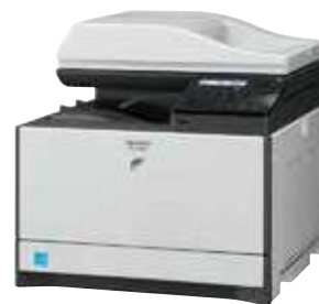
MX-C300W mostrado con bandeja para papel de 500 hojas (izquierda) y configuración estándar (derecha).