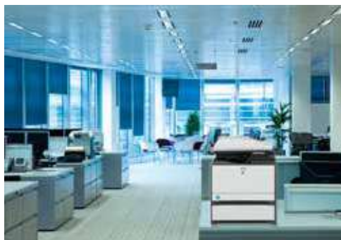
Compacto y potente para entornos de grupos de trabajo.