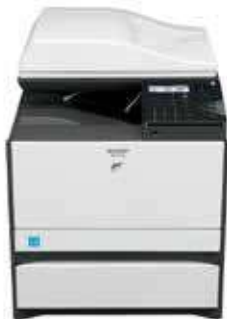
MX-C300W con MXCS11