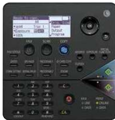
Panel de control del modelo MX-C300W