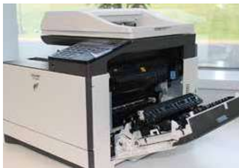
El acceso cómodo a la trayectoria del papel desde la puerta lateral facilita eliminar los atascos.