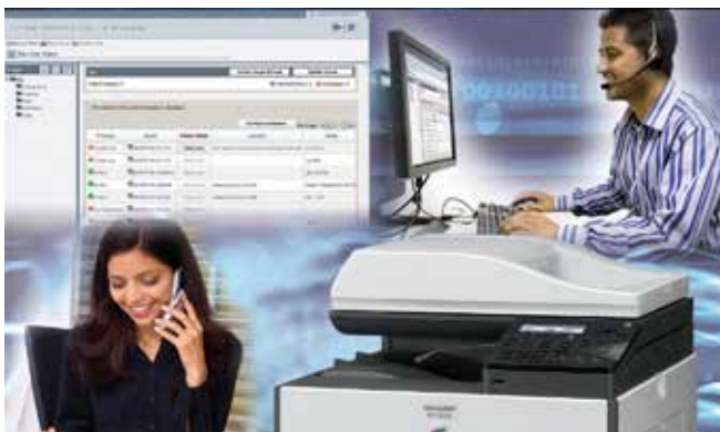
Administrador remoto de dispositivos de Sharp.