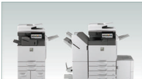
MX-305 se muestra en la configuración compacta con acabadora interna y en la configuración completa con acabadora de encuadernación en caballete y depósito de gran capacidad.

Sharp siempre ha sido reconocido por mejorar la productividad de las MFP en el lugar de trabajo ofreciendo funciones innovadoras fáciles de usar. Sharp lo ha hecho de nuevo con la nueva función MFP Voice disponible para los nuevos sistemas de documentos a color de la Serie Essentials. Con la función de MFP Voice de Sharp podrá interactuar con la máquina usando simplemente el poder del lenguaje. Con comandos simples de voz, podrá solicitar al sistema de documentos de Sharp que copie o escanee un documento.