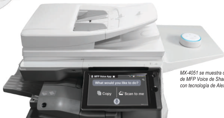
MX-4051 se muestra con la función de MFP Voice de Sharp disponible con tecnología de Alexa.